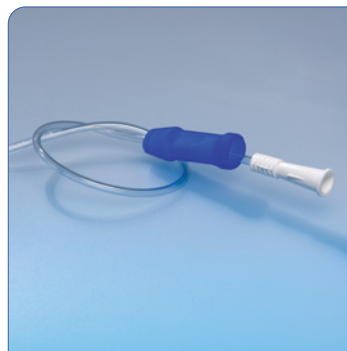
• Flexibilité adéquate