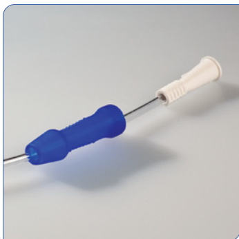
• Blue Grip®

Les sondes à revêtement hydrophile Cure disposent d'un revêtement hydrophile et sont exemptes de DEHP. Les sondes, tant pour homme que pour femme, disposent d'œillets polis qui rendent l'insertion sans risque et préviennent les irritations. De plus, toutes les sondes pour homme sont équipées du dispositif unique Blue Grip®; un accessoire ingénieux permettant l'insertion des sondes sans avoir à les toucher avec les mains. Ceci rend l'acte plus facile, plus hygiénique et réduit considérablement le risque d'infections. Les sondes à usage unique sont stériles et emballées individuellement.