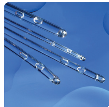
• Le revêtement hydrophile est prêt à l'emploi après 25 sec.